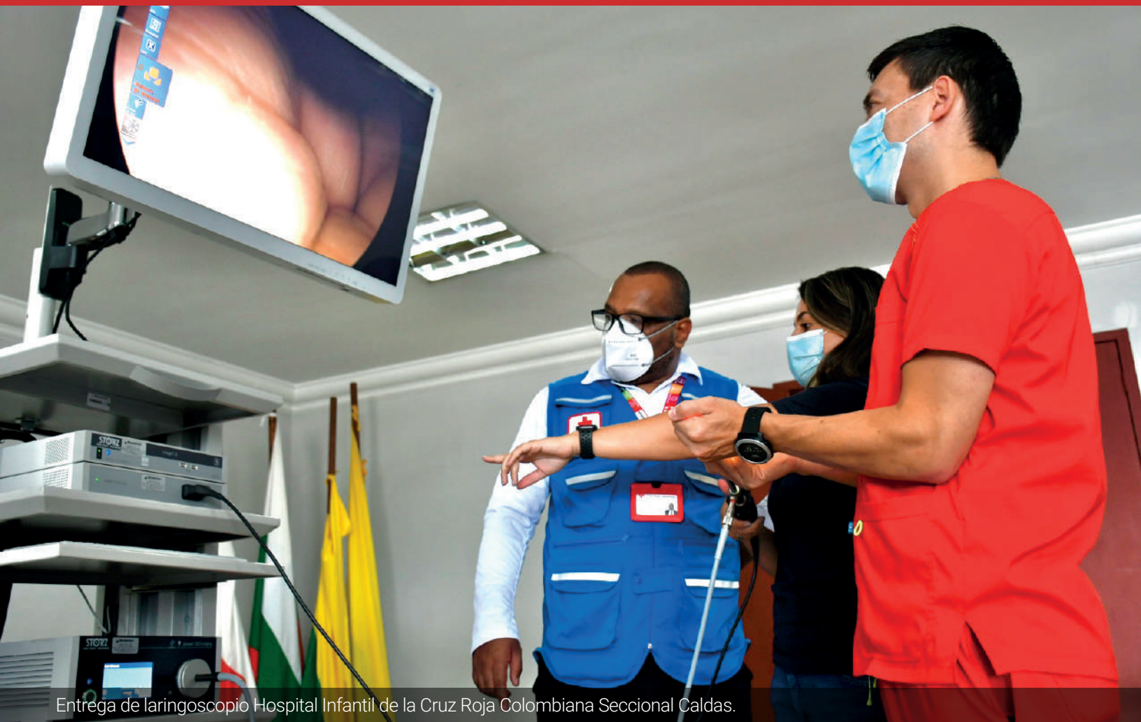
Entrega de laringoscopio Hospital Infantil de la Cruz Roja Colombiana Seccional Caldas.

La Sociedad Nacional de la Cruz Roja Colombiana, en el marco del Proyecto para el fortalecimiento de la capacidad de respuesta de la red hospitalaria en Colombia, gracias a la financiación de la Agencia de los Estados Unidos para el Desarrollo Internacional y el trabajo conjunto con la Federación Internacional de la Cruz Roja y la Media Luna Roja, inició su segunda ruta de entrega de equipos médicos a las IPS de las seccionales de la Cruz Roja a nivel nacional.