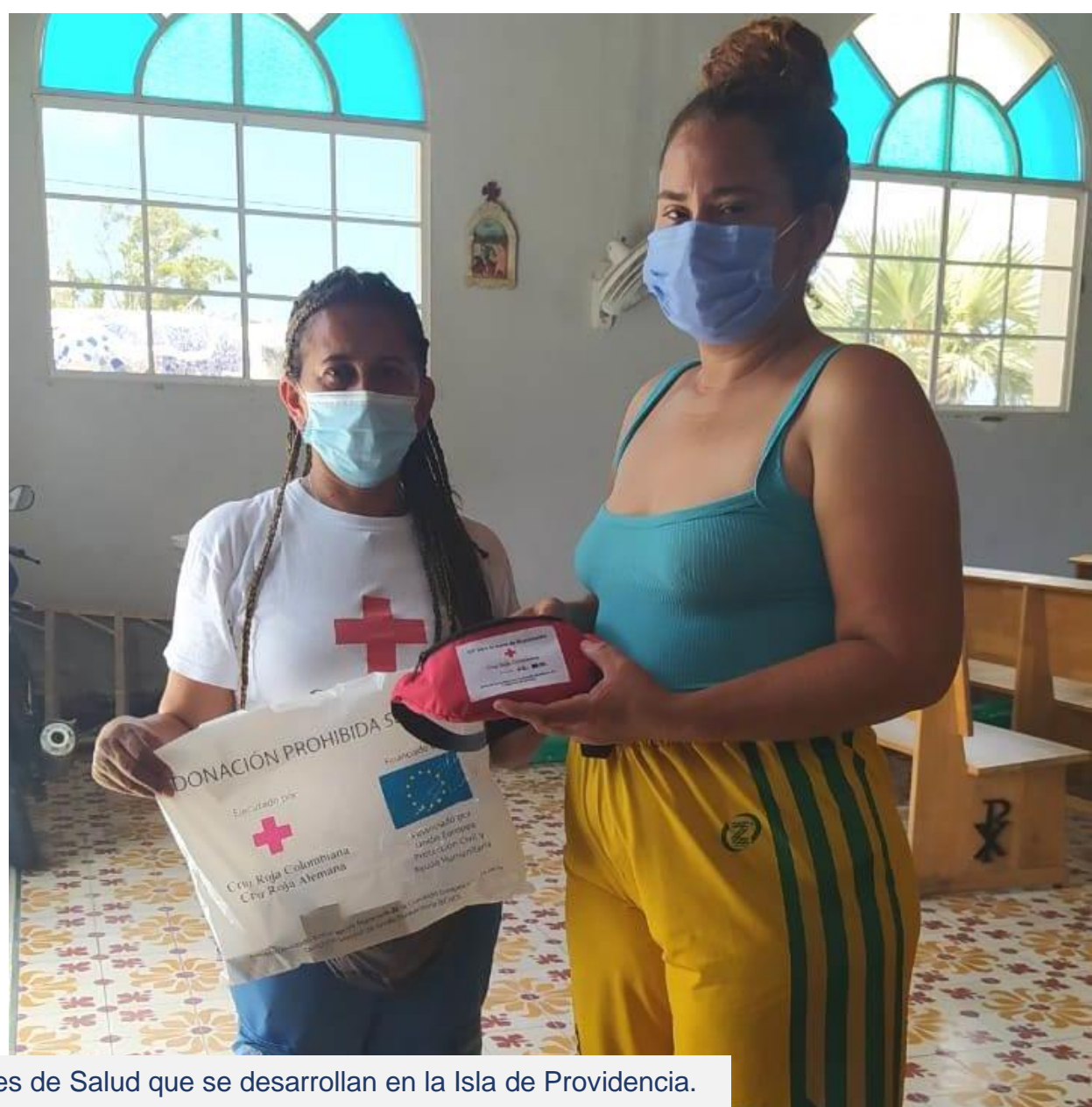
Actividad de entrega de glucómetros, dentro de las acciones de Salud que se desarrollan en la Isla de Providencia.