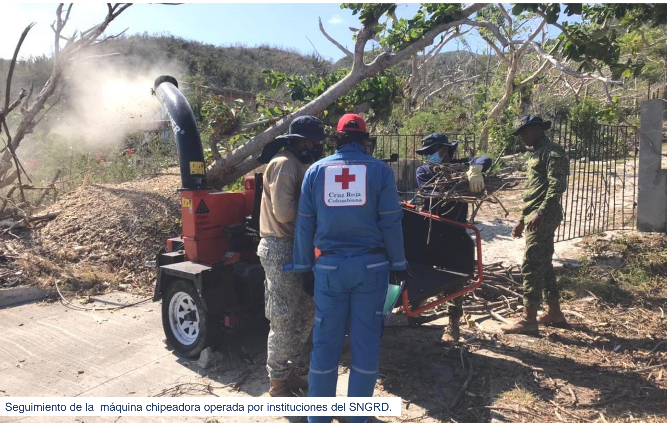
Seguimiento de la máquina chipeadora operada por instituciones del SNGRD.