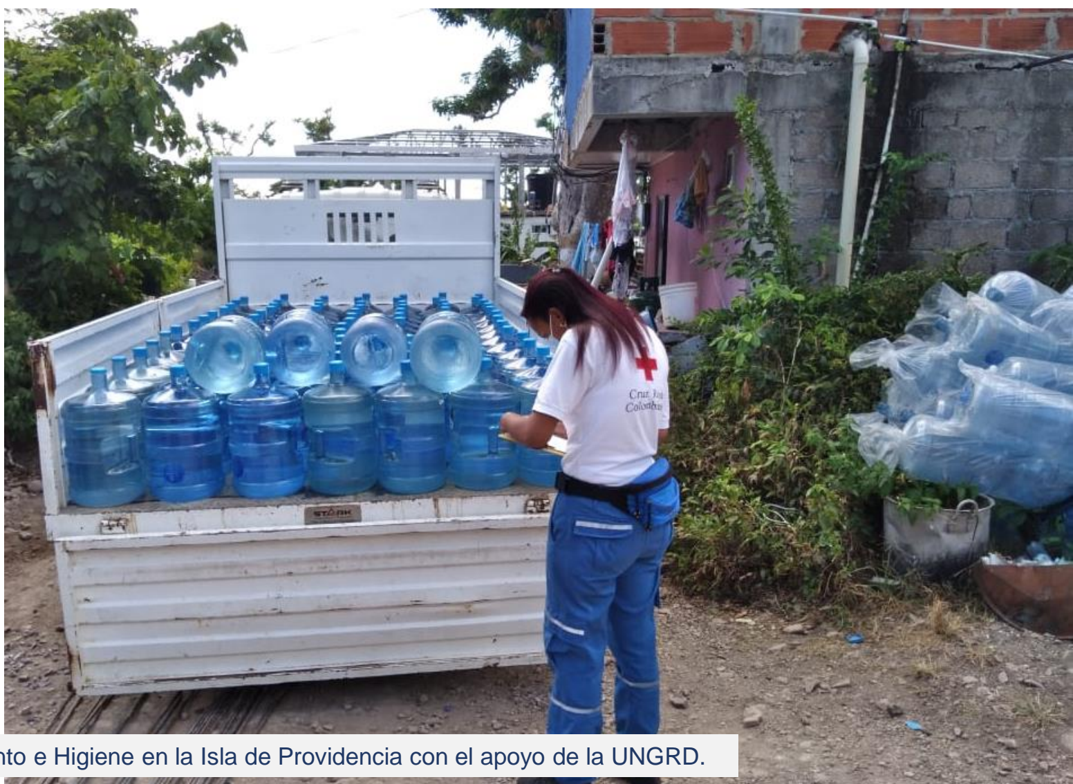
Actividades de Agua, Saneamiento e Higiene en la Isla de Providencia con el apoyo de la UNGRD.