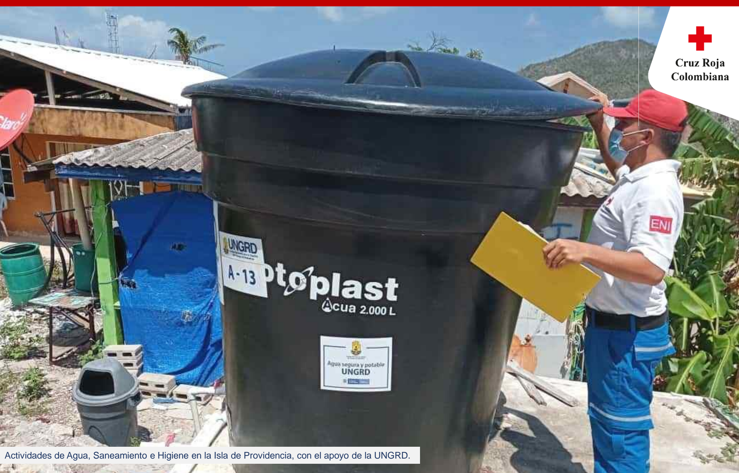
Actividades de Agua, Saneamiento e Higiene en la Isla de Providencia, con el apoyo de la UNGRD.