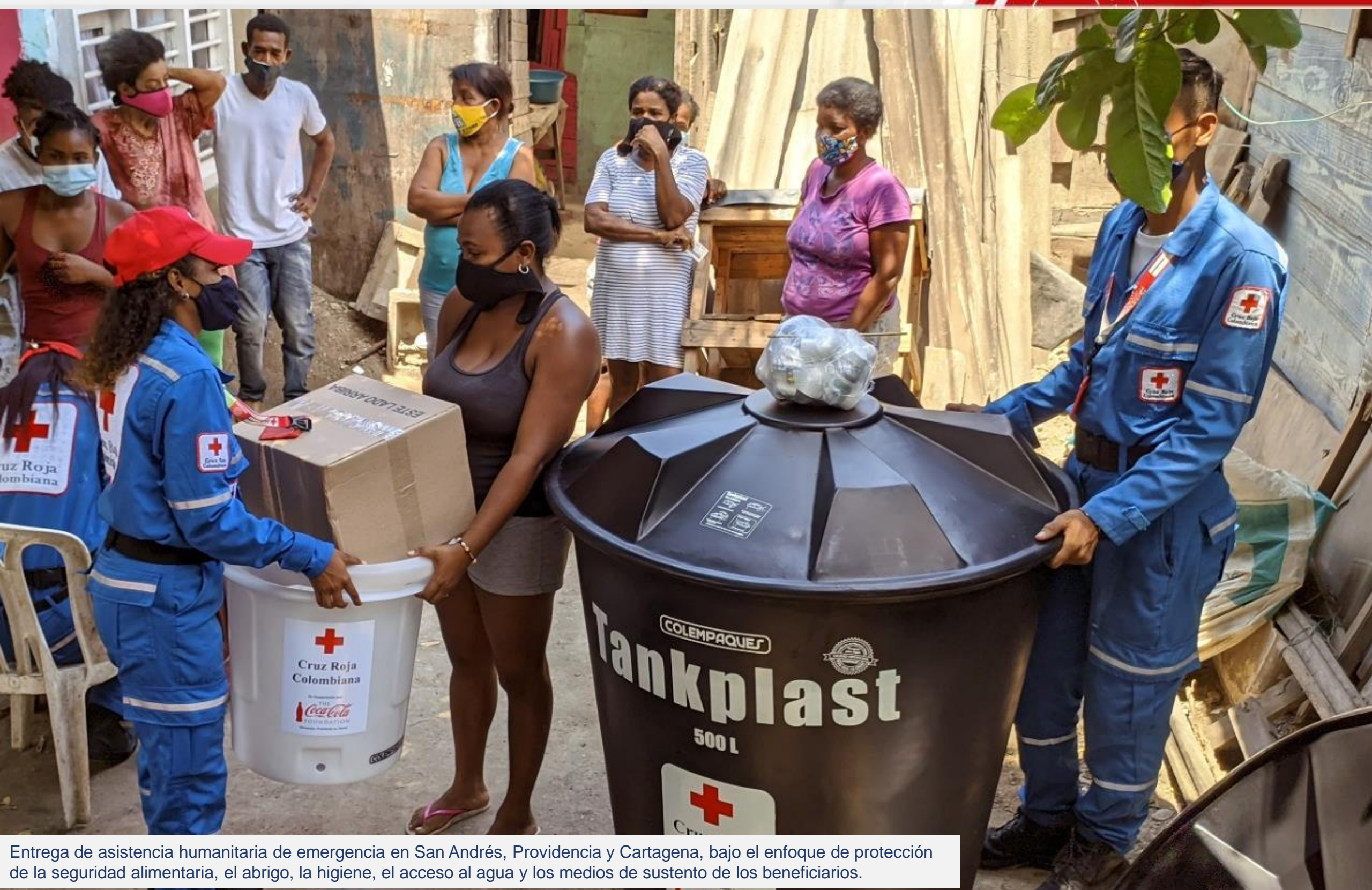
Entrega de asistencia humanitaria de emergencia en San Andrés, Providencia y Cartagena, bajo el enfoque de protección de la seguridad alimentaria, el abrigo, la higiene, el acceso al agua y los medios de sustento de los beneficiarios.