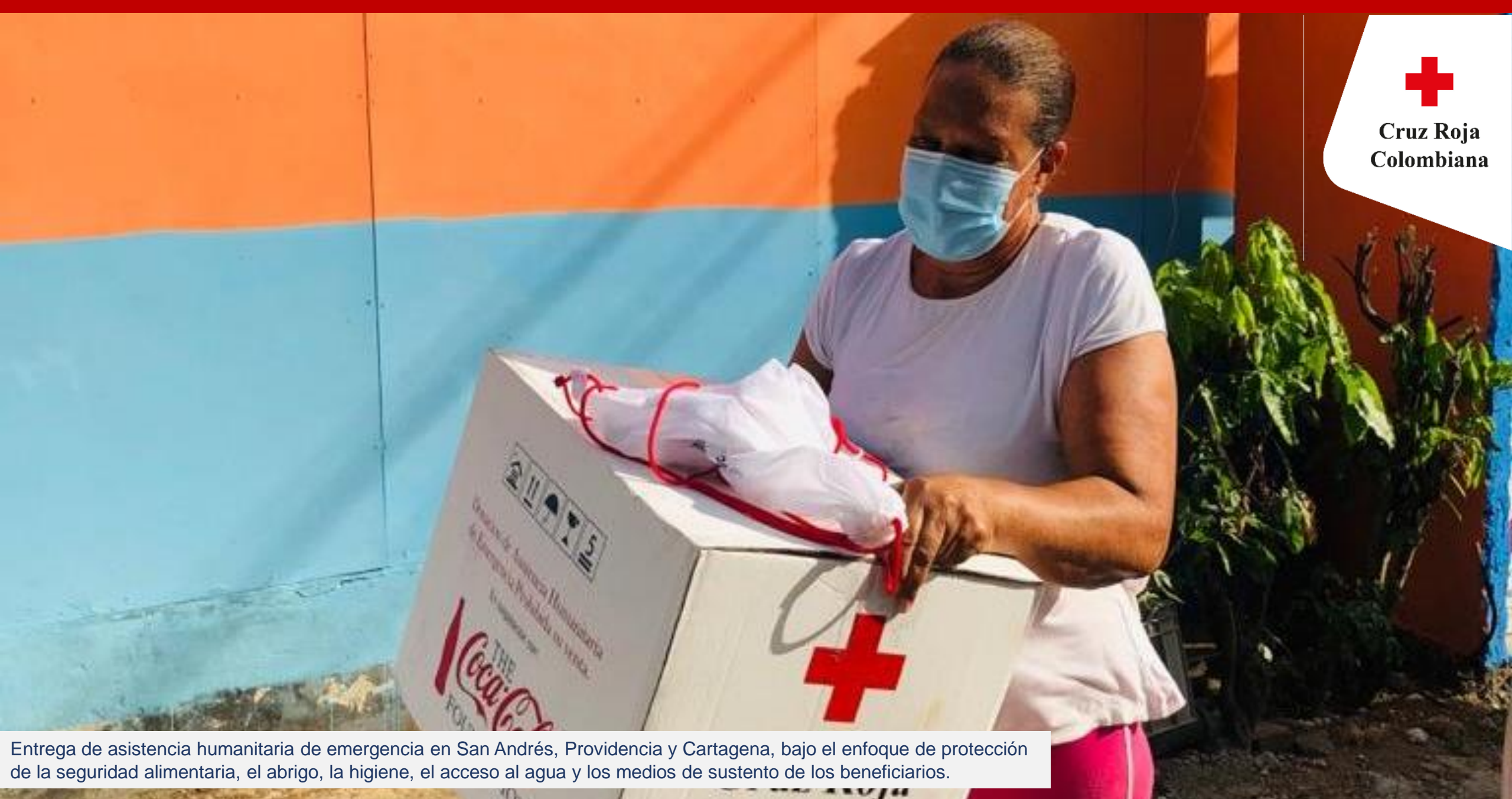
Entrega de asistencia humanitaria de emergencia en San Andrés, Providencia y Cartagena, bajo el enfoque de protección de la seguridad alimentaria, el abrigo, la higiene, el acceso al agua y los medios de sustento de los beneficiarios.