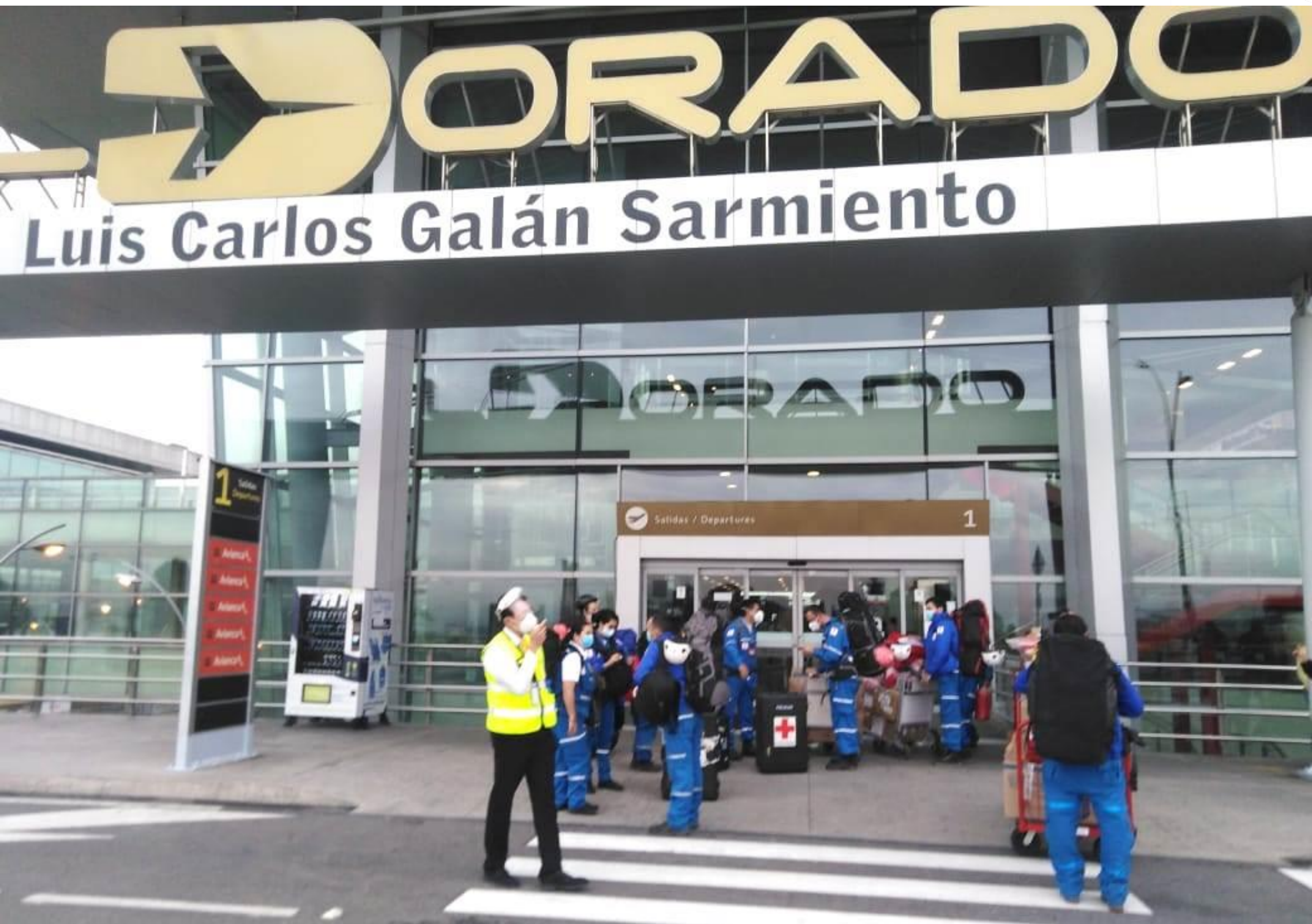
Segundo equipo de especialistas de la Cruz Roja Colombiana en desplazamiento al Archipiélago