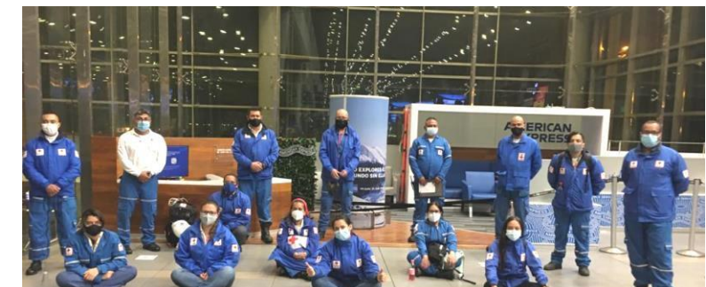
Equipo de la SNCRC que se desplaza a apoyar la emergencia