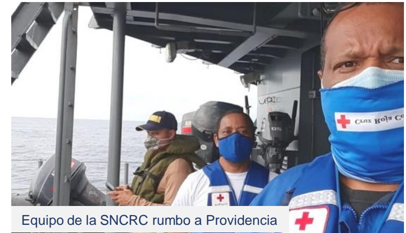
Equipo de la SNCRC rumbo a Providencia