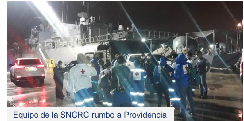
Equipo de la SNCRC rumbo a Providencia