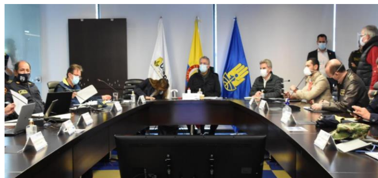
Participación SNCRC en Comité Nacional de Manejo de Desastres