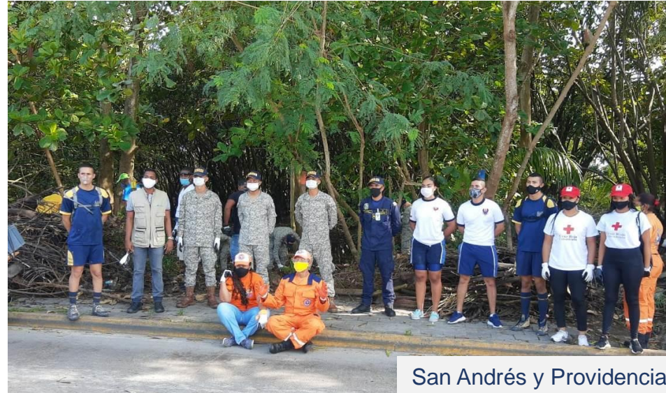
San Andrés y Providencia