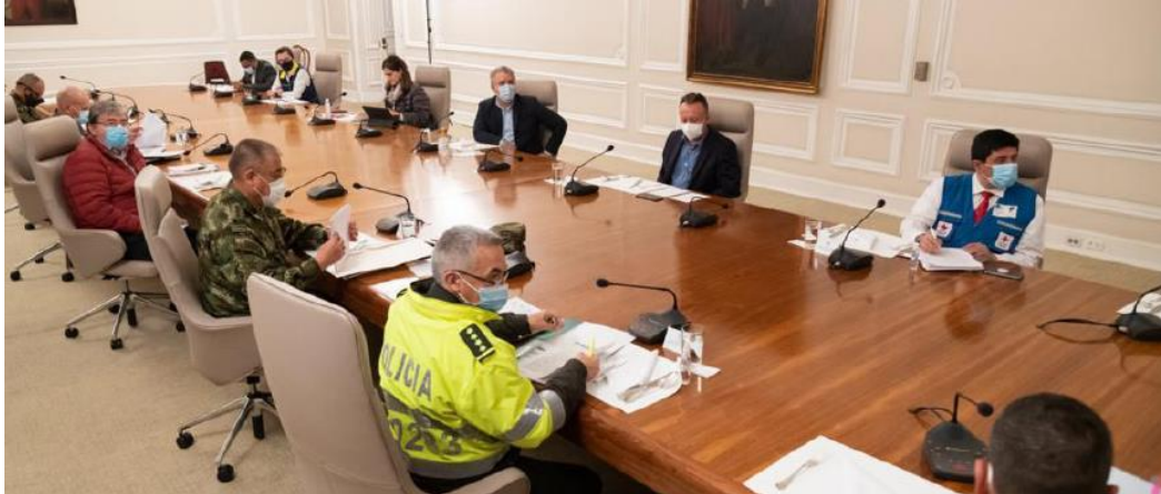
Puesto de Mando Unificado liderado por el Presidente de la República