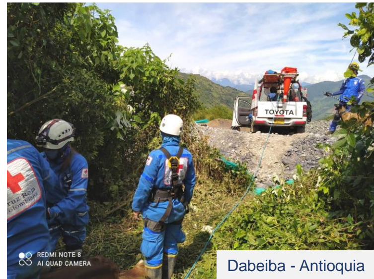
Dabeiba - Antioquia