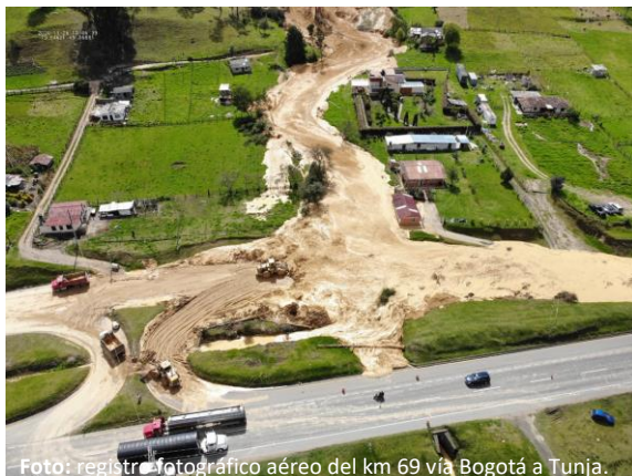
Foto: registro fotográfico aéreo del km 69 vía Bogotá a Tunja.

Antioquia, Norte de Santander, Cundinamarca, Santander, Bolívar, Cauca, Risaralda, Sucre, Atlántico y Chocó son los departamentos que han registrado mayor número de municipios con algún tipo de evento que los haya afectado.